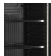
Éclairage LED dans le cadre de la porte