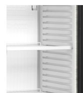
Éclairage LED dans le cadre de la porte