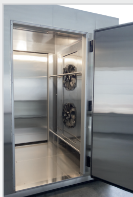
Barres intérieures et extérieures de protection en inox

Un tunnel de surgélation Hengel, cela représente des gains en productivité ainsi que l'assurance de surgeler vos produits en respectant leur qualités gustatives et leur aspect d'origine.