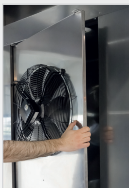
Accès simplifié à l'évaporateur pour la maintenance et le nettoyage