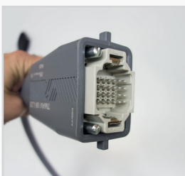
Installation facilitée grâce à un système de connecteurs