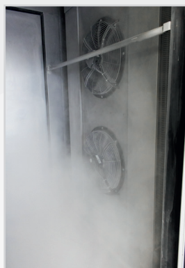
Évaporateur vertical avec pas d'ailette adapté pour retarder la formation de givre