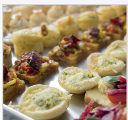
Conservation des qualités gustatives et absence de dessèchement