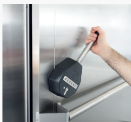
Large poignée pivotante avec possibilité de verrouillage + Poignée intérieure anti-panique