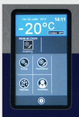
Interface tactile simple et intuitive