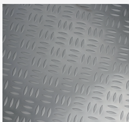
Sol isolant (épaisseur 100 mm)